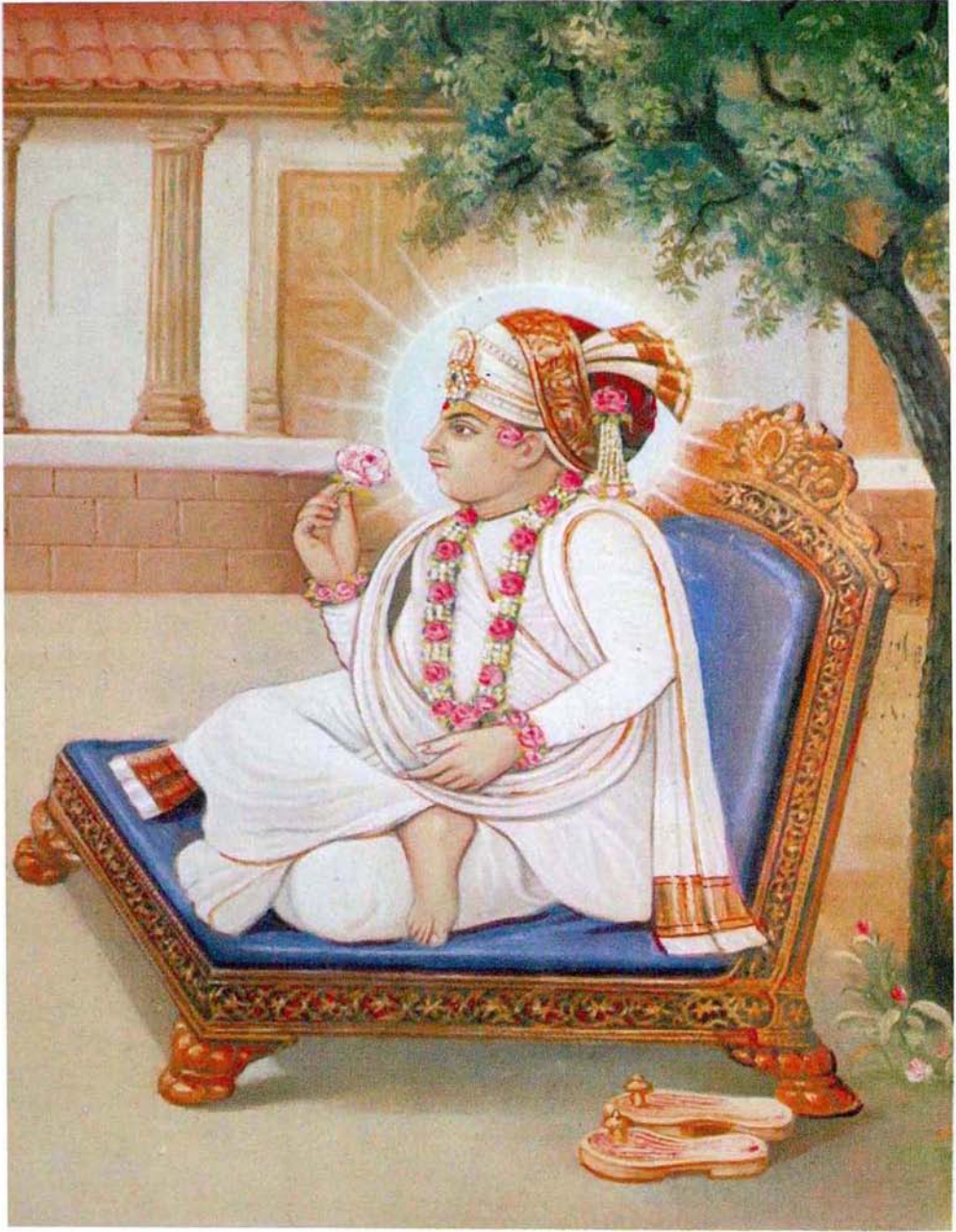
सर्वोपरी उपास्य मूर्ति पूर्वा पुरुषोत्तम श्री स्वामिनारायण भगवान